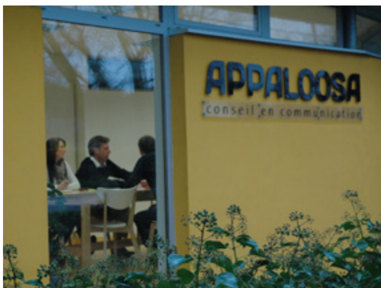
L'entreprise a été reprise en Scop fin 2009 par deux salariés. À l'occasion elle a changé de nom et passé de « Agrimages » à « Appaloosa ».

A ppaloosa est une agence de conseil en communication, basée à Plouigneau (29), près de Morlaix. Créée en 1985 sous le nom d'Agrimages, la structure est passée sous le statut de Société coopérative et participative (Scop) en 2009, après une reprise par deux de ses salariés. Reportage au sein de cette jeune entreprise dynamique.